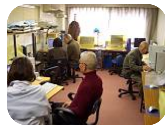
木曜日クラス風景