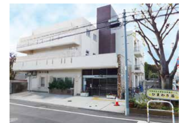
〒158-0098 世田谷区上用賀 5-24-18