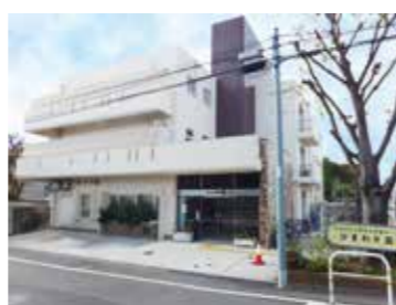
世田谷区立障害者休養ホーム ひまわり荘