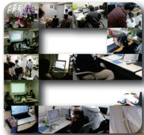
昨年はこんなこともありました