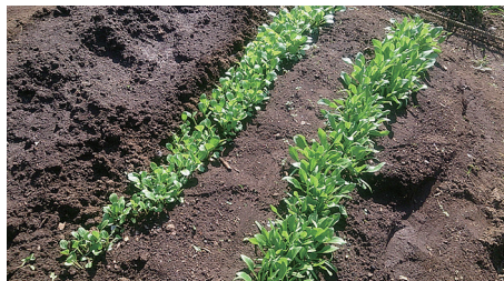
まだ若いチンゲン菜やほうれん草