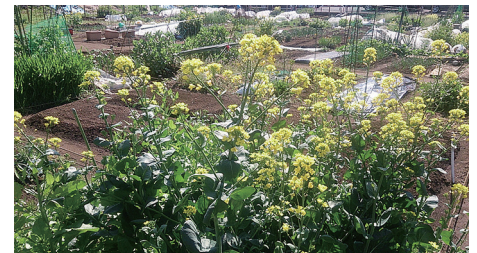
今が食べごろの菜の花