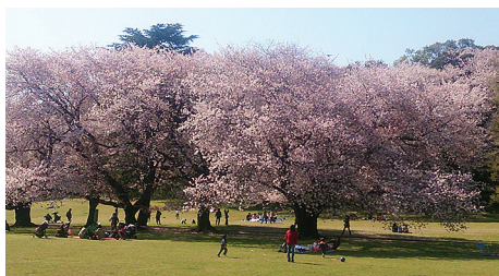
どこを向いても一面の桜が見られる