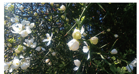
花の種類も実にさまざま