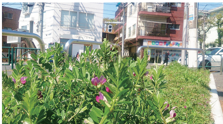
街中では様々な花が見られます