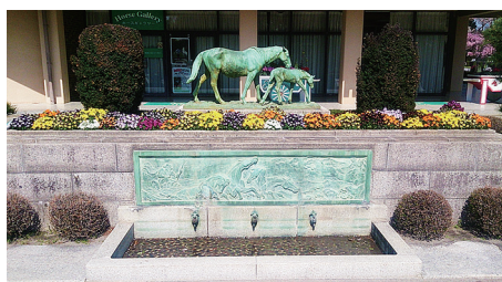
馬に関連するものが各所にあります