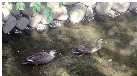
小川では鴨が気ままに泳いでいた