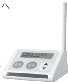
迷惑電話チェッカー