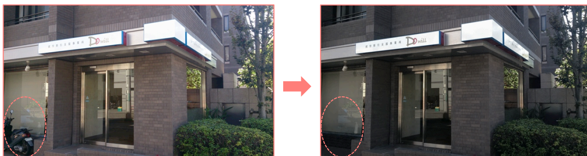
Before 「案内図・初期提出」