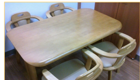
「新研修所内 テーブル・チェア」

3D完成図のため、レンジフードから給湯器、蛍光灯等、SketchUpを用いて作成しました。 引き出しやスイッチの場所等、細かに再現されています。